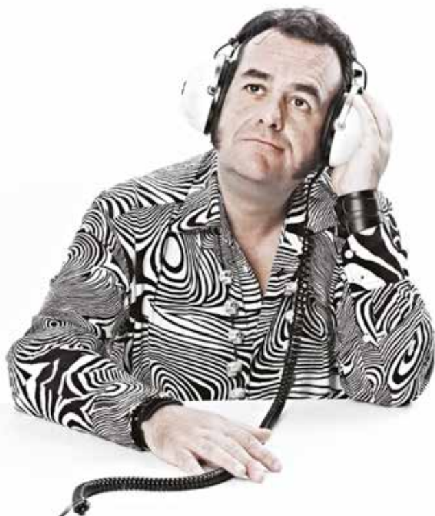
DOP MASSACRE AKA DJ SAUCISSE IZEL, samedi 20 juin, 19 h.