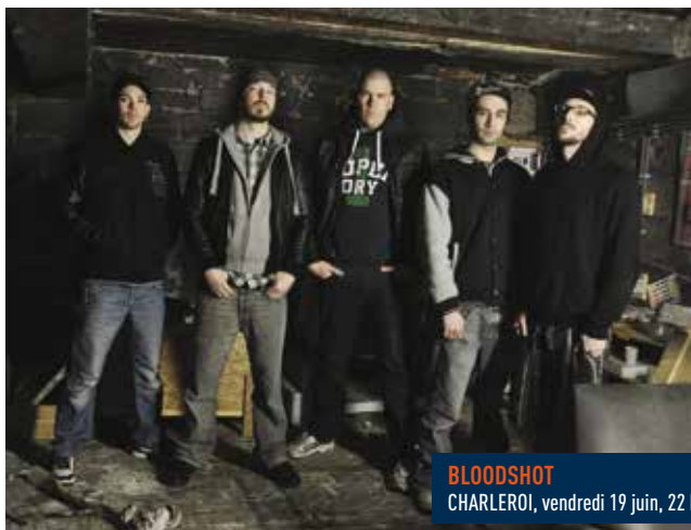
BLOODSHOT CHARLEROI, vendredi 19 juin, 22 h.