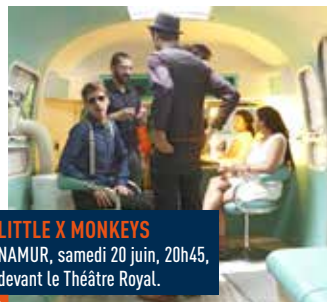
LITTLE X MONKEYS NAMUR, samedi 20 juin, 20h45, devant le Théâtre Royal.

Vendredi 19, samedi 20 et dimanche 21 juin.