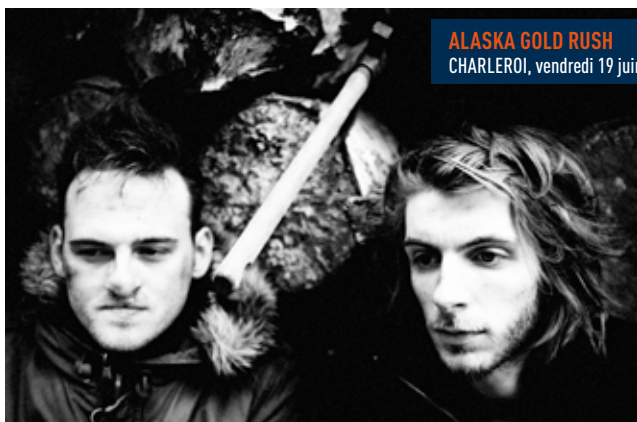
ALASKA GOLD RUSH CHARLEROI, vendredi 19 juin.