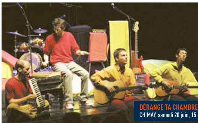
DÉRANGE TA CHAMBRE CHIMAY, samedi 20 juin, 15 h.