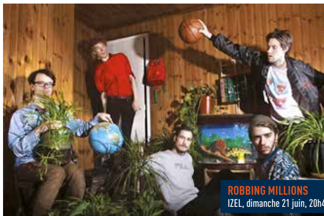
ROBBING MILLIONS IZEL, dimanche 21 juin, 20h45.

AVEC E.A. ELLE ET SAMUEL, DANS DANS, DARIO MARS AND THE GUILLOTINES, DOP MASSACRE, RAKETKANON, ROBBING MILLIONS, CHAPELIER FOU, MOUNTAIN BIKE INFOS: 063 / 45 60 84