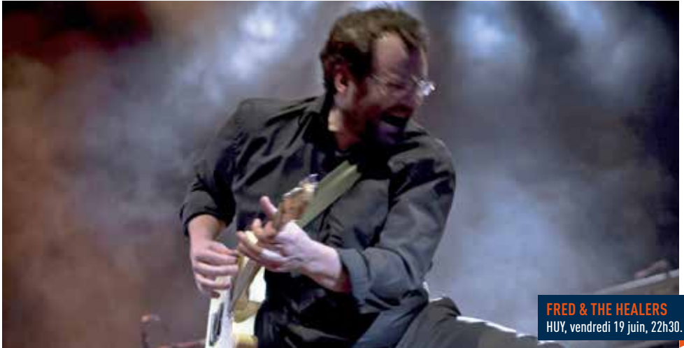
FRED & THE HEALERS HUY, vendredi 19 juin, 22h30.