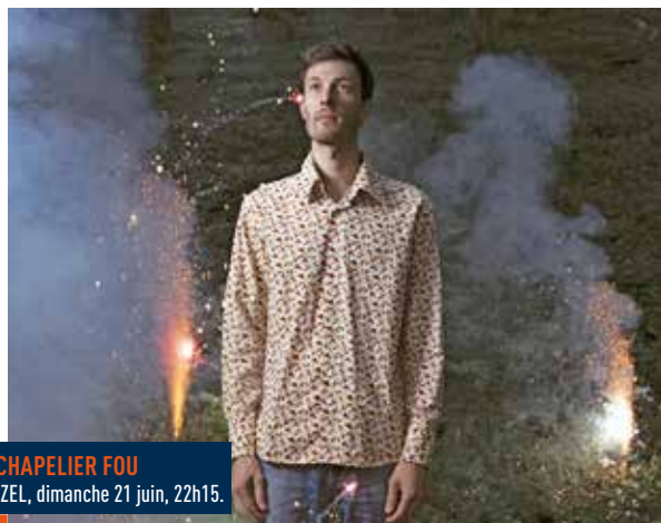
CHAPELIER FOU IZEL, dimanche 21 juin, 22h15.