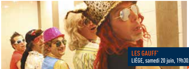
LES GAUFF' LIÈGE, samedi 20 juin, 19h30.

Quel programme! Concerts et animations aux quatre coins de Liège. Jazz, rock, musiques du monde, funk, musique classique, chanson française, blues, pop, swing, hip-hop, électro, reggae, ska, house... Vous l'avez compris, ça sera animé dans les rues de Liège! Les kids ne seront pas oubliés non plus! Consultez le